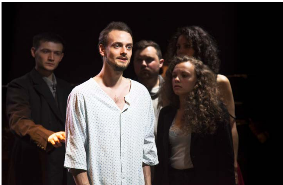
Photo de répétition

Le chaos gagne, la révolte gronde, et le pouvoir est menacé. L'Empereur supplie la Mort de reprendre sa mission. Elle accepte à une condition : qu'il soit le premier à mourir. L'Empereur cède regrettant de n'avoir pu terminer son œuvre : éradiquer la race humaine pour sauver la planète. Il prophétise que d'autres guerres suivront.