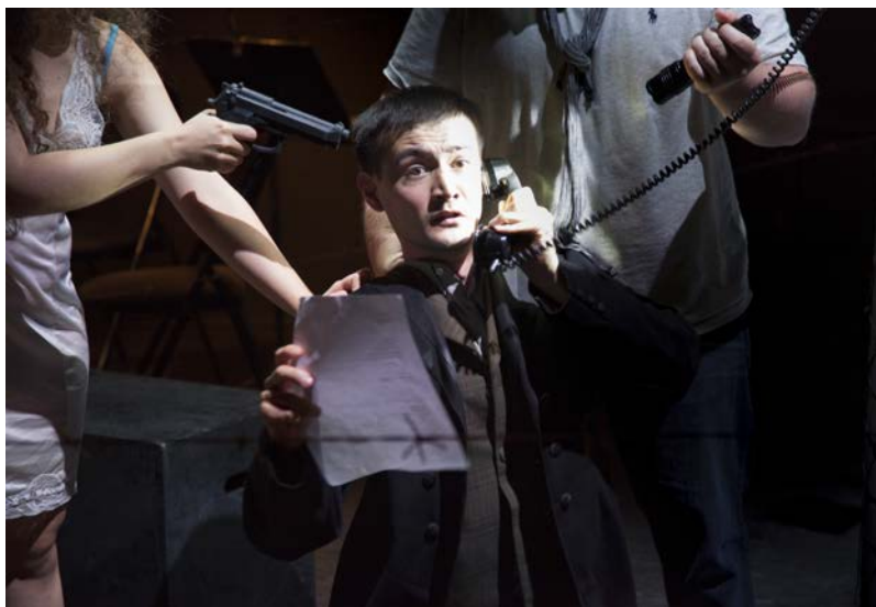
Photo de répétition

Le Haut-parleur donne à l'Empereur, retranché dans ses appartements, des nouvelles du théâtre des opérations. Mais soudain des événements étranges sont rapportés : un condamné à mort survit à son exécution, les soldats ne parviennent pas à mourir.