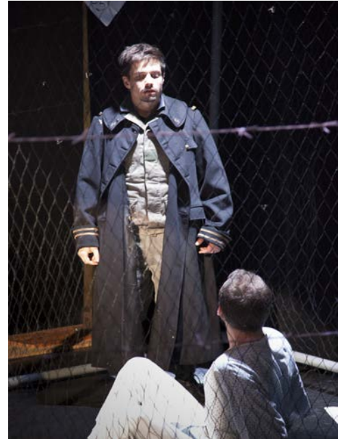
Photo de répétition

Le Tambour, porte-parole de l'Empereur, intervient pour transmettre un appel à la guerre générale et totale. La Mort, ulcérée de se faire déposséder de sa mission, se met en grève : désormais, les hommes ne pourront plus mourir.